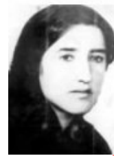
فضیلت دارانی ★