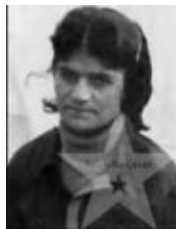
ویسی درخشان ★