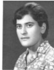
شہلا کعبی ★