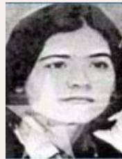
رستم گرجی پروین