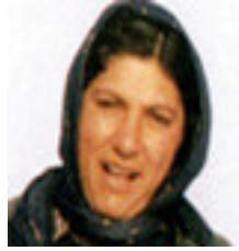
پیشیاری کلی ★