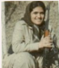
ادمن فرح ★