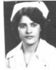
نسرین کعبی ★